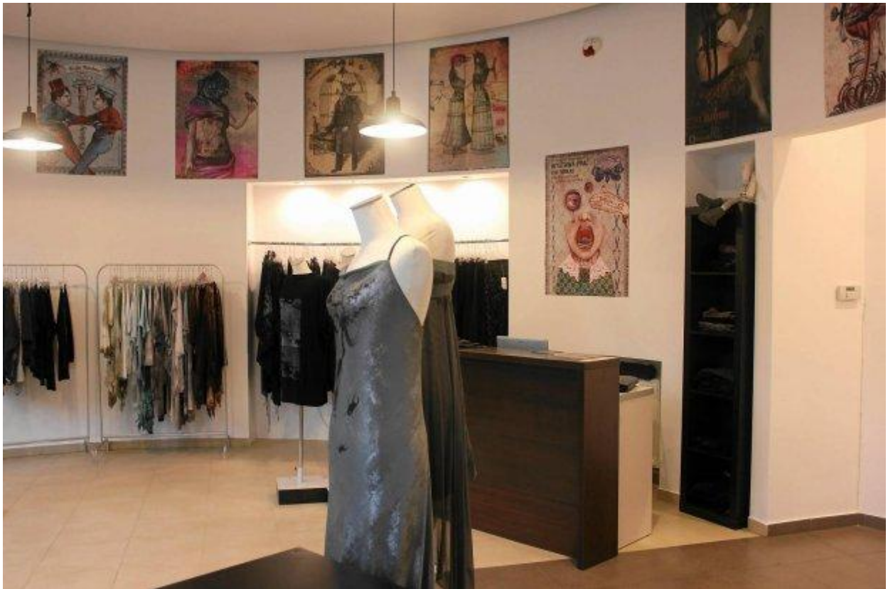
Imago-art w Katowicach (IMAGO-ART)